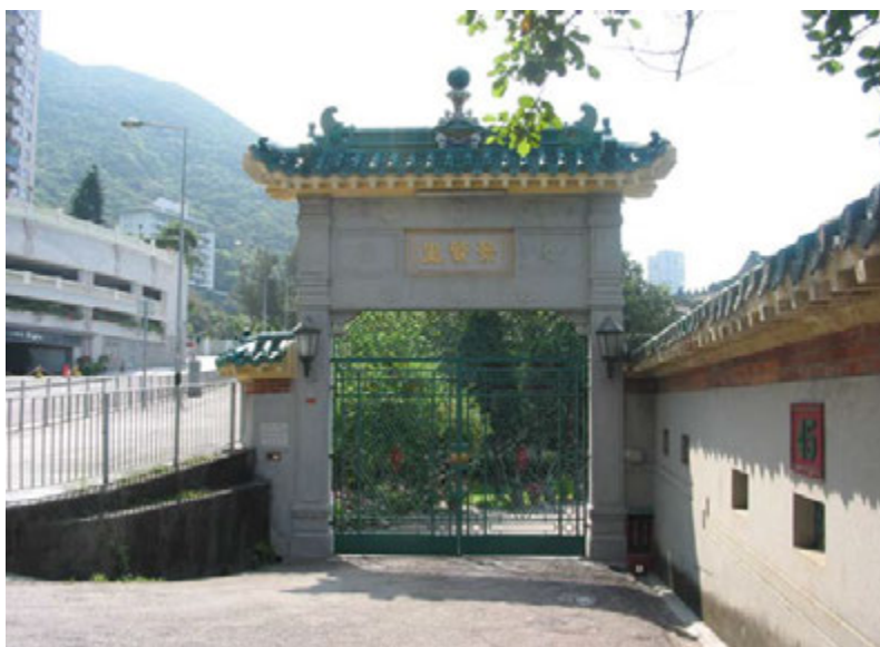
Entrance of the Building 建築物的入口