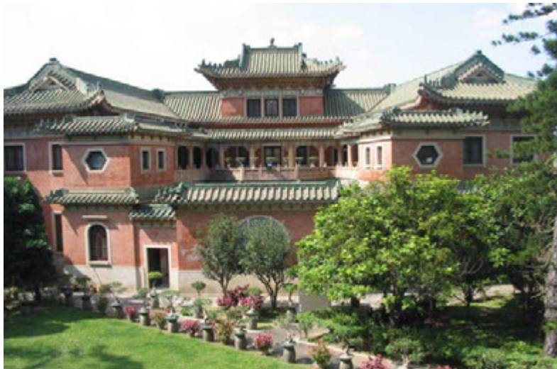
The Building at 45 Stubbs Road 位於司徒拔道 45 號的建築物